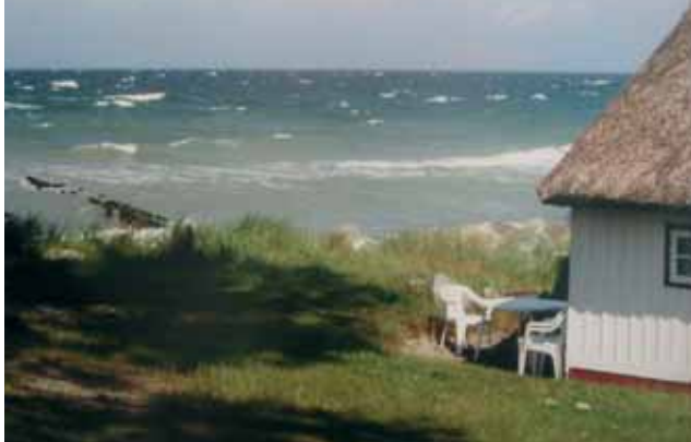
Windplatz | Fotografie

Der Maler Paul Müller-Kaempff, der als Entdecker Ahrenshoops gilt, schrieb 1926 in seinen „Erinnerungen an Ahrenshoop“: