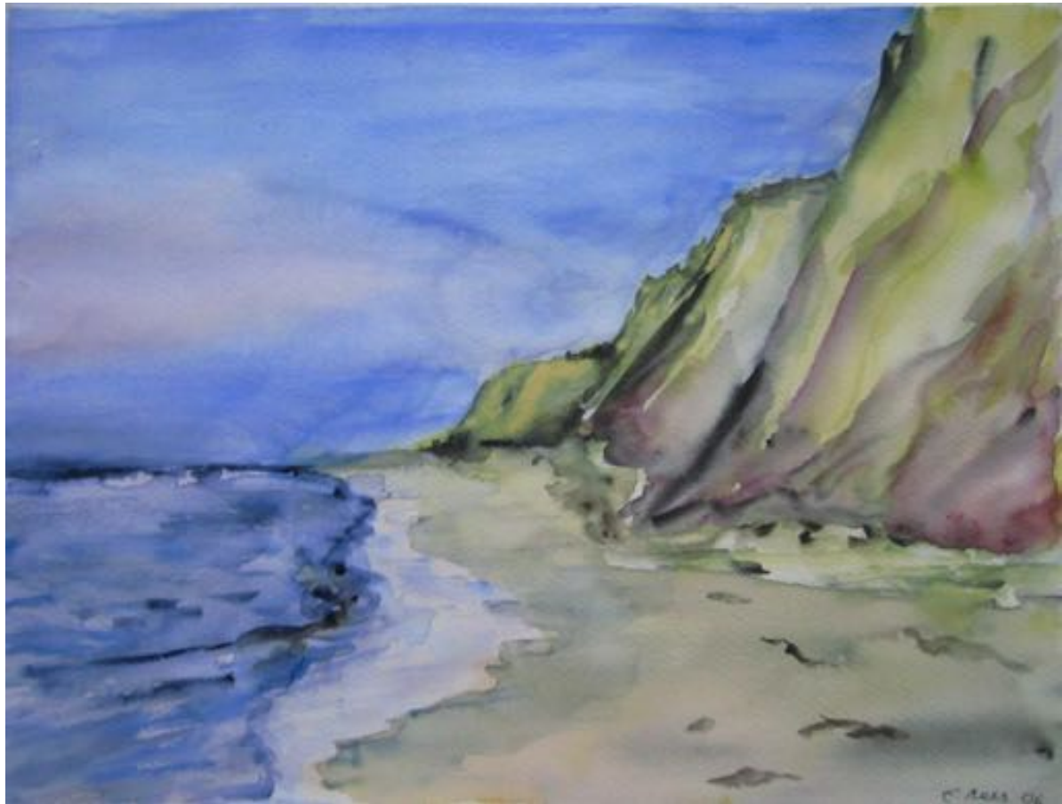
STEILKÜSTE IM NOVEMBER AQUARELL 17 X 24 2006