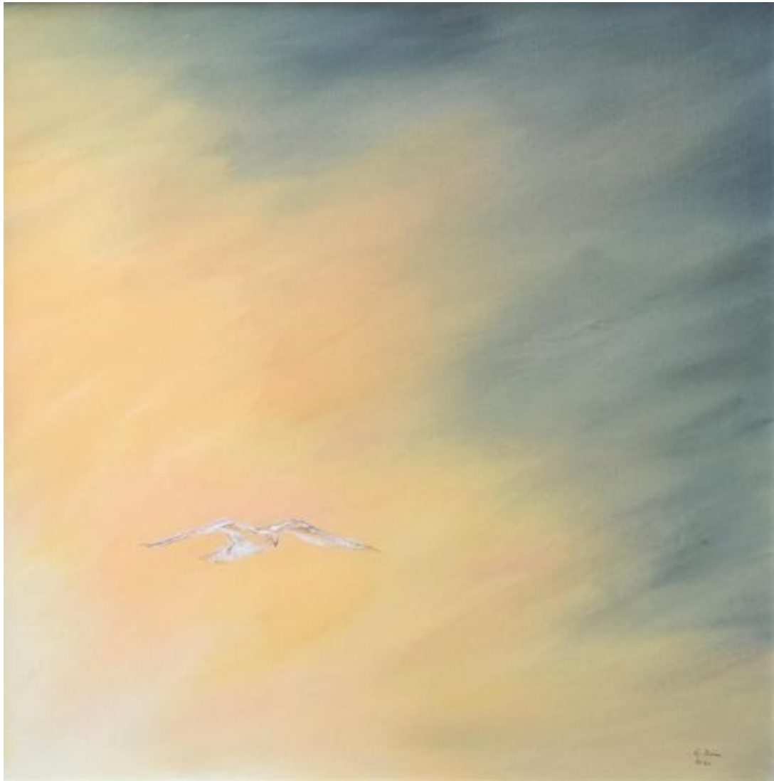
HOFFNUNG ÖL AUF LW 50 X 50 2020