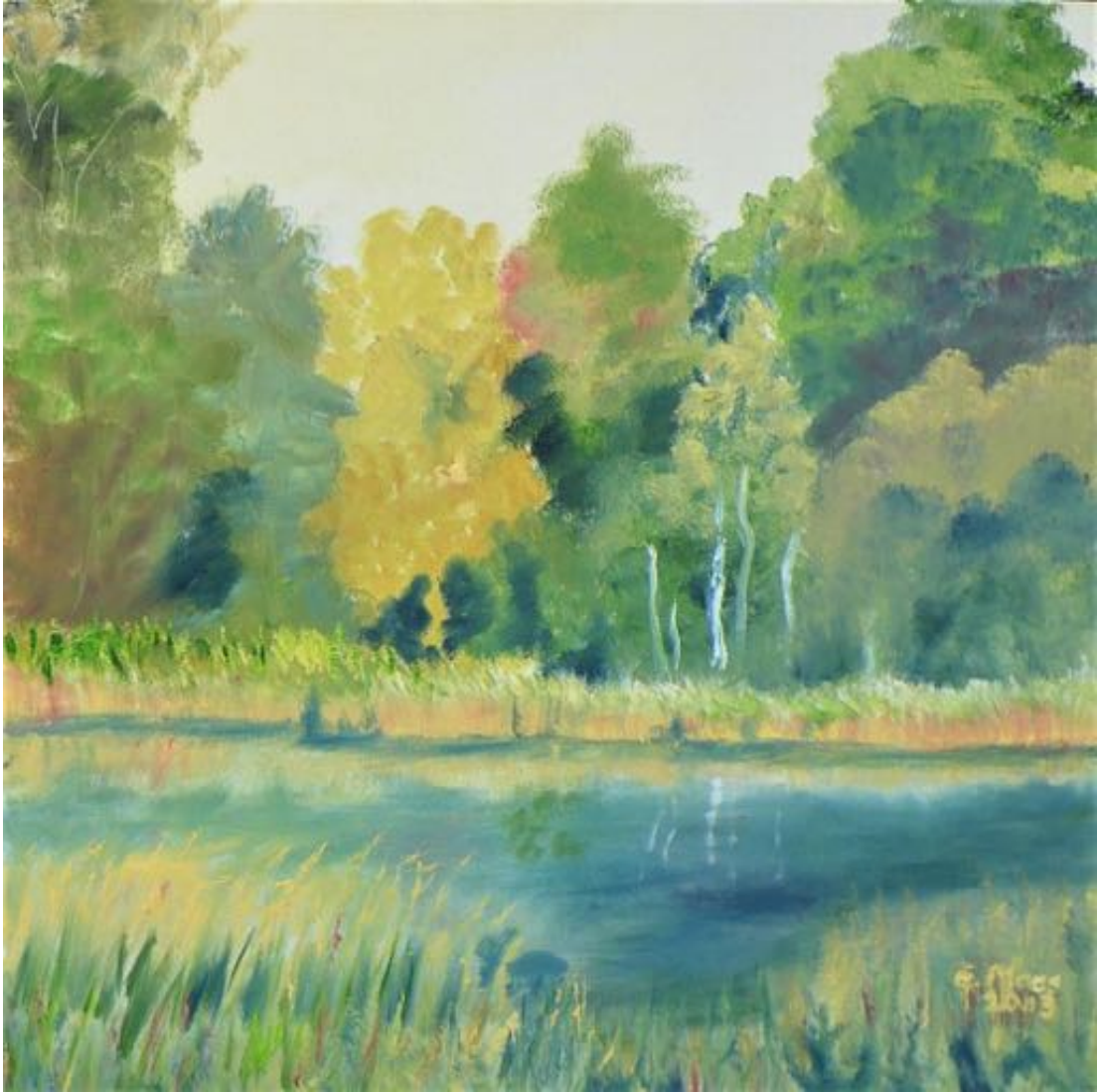
SPEKTEGÜRTEL SPANDAU ÖL AUF LW 50 X 50 2013