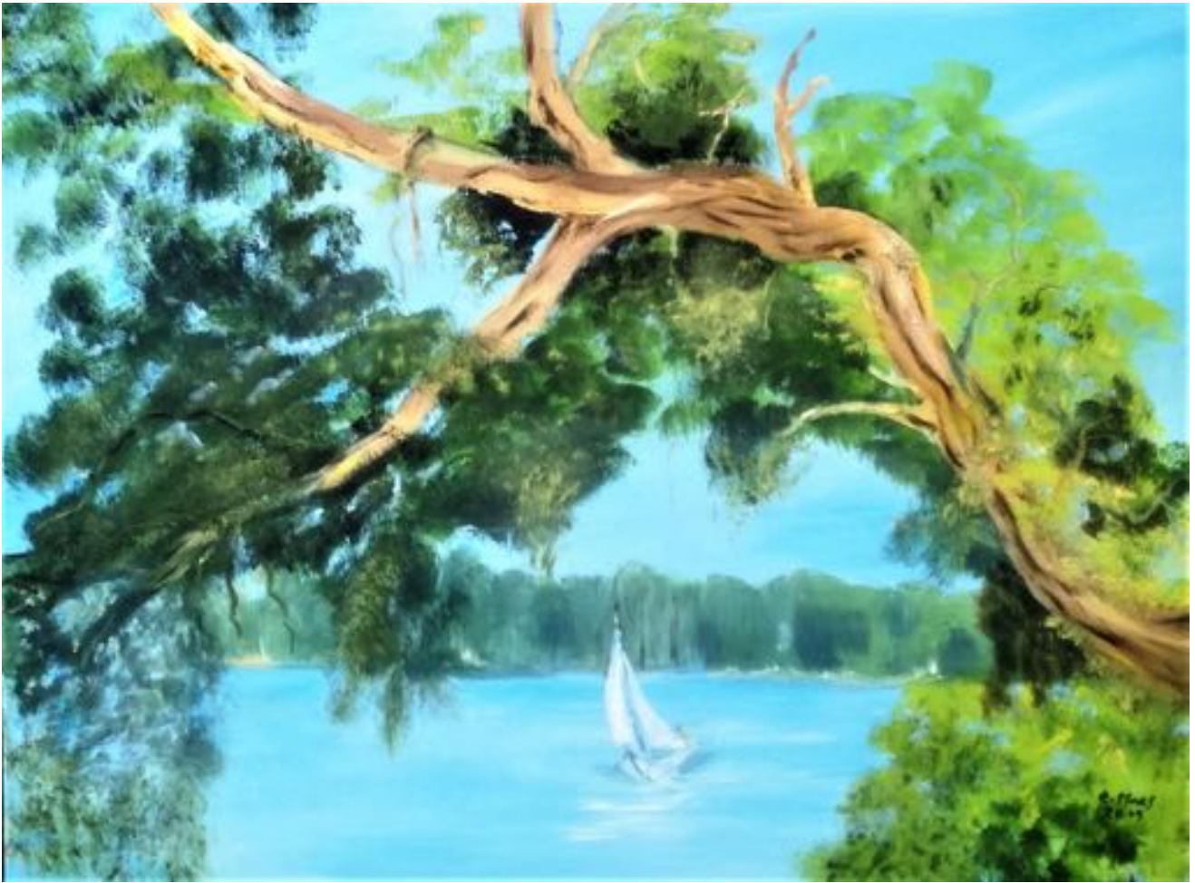
GEBEUGT ÖL AUF LEINWAND 60 X 80 2019