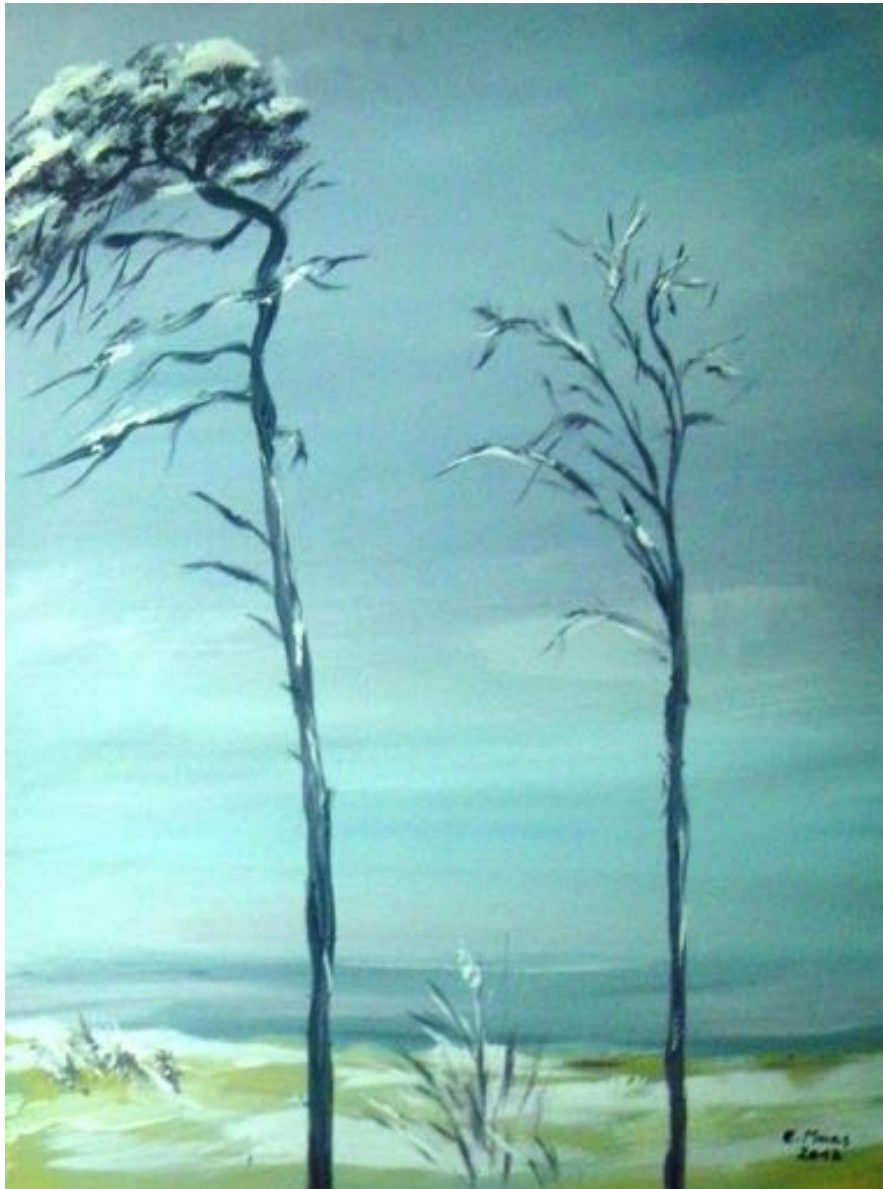
WINTER AM WESTSTRAND ACRYL AUF LW 80X60 2012