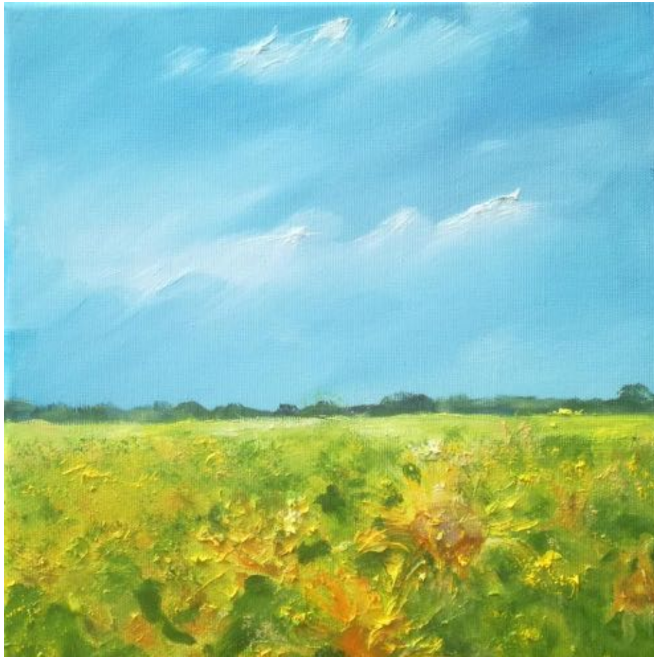
LETZTE SONNENBLUMEN ÖL AUF LEINWAND 30X30 2020