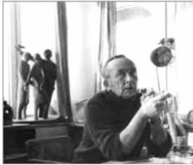
Atelier Ahrenshoop ca. 1980