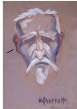
RBF: Greiser Mann, Rom /Pastellkreide/ 1930

Abends sind wir in eine Kneipe gegangen, da wußten schon viele, dass ich den Ortsgewaltigen gemalt hatte. Buchstäblich die ganzen Männer des Dorfes versammelten sich um uns herum. Es wurde musiziert Wir haben auch Krach gemacht, das meint, wir haben auch musiziert.