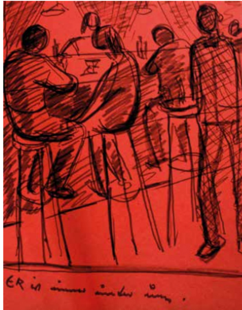
...an der Bar