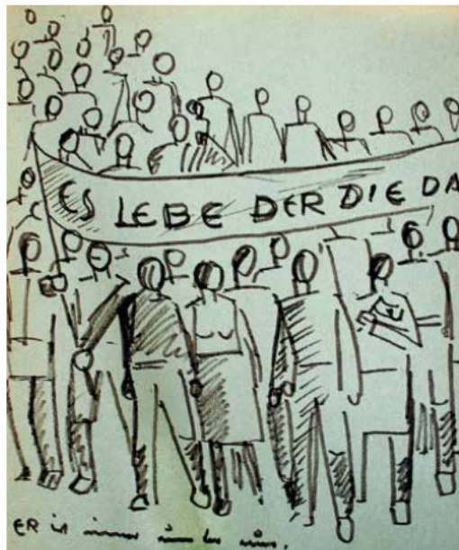
...bei einer Demo