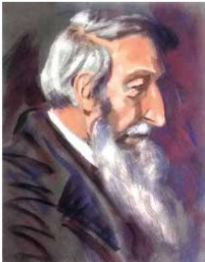
RBF: Kapitän /Pastellkreide/ 1930

Entschuldige bitte, aber ich bin heute nicht dazu gekommen, den Brief zu beenden. Wir haben nun Roma immortale den Rücken gewandt. ... Wir sind über Formia nach hier gekommen. Wohin meinst Du? Ich weiß selbst nicht, wie das Dorf heißt, nur weiß ich, dass es märchenhaft schön liegt. 1. Am Meer 2. Im Gebirge + dazwischen ist so etwas wie eine Sandwüste. Dort haben wir gestern den ganzen Tag gelegen+ haben gemalt, gebadet + ich habe gesponnen-Gedanken natürlich. Ein italienischer Künstler stieß auf uns+ meldete sich zum Besuch für Nachmittag an. Er kam aber nicht allein, sondern brachte einen Arzt mit. Nachdem sie beide meine Arbeiten angesehen hatten, fragte mich der Arzt, ob ich ihn malen wollte. Ja. Also ran an den Feind. Wir sind in seine Villa gegangen + ich habe ihn gemalt in Kreide. Ganz gut geworden. Dann gab es Wein, Biscuit, Zigaretten, Kaffee etc.