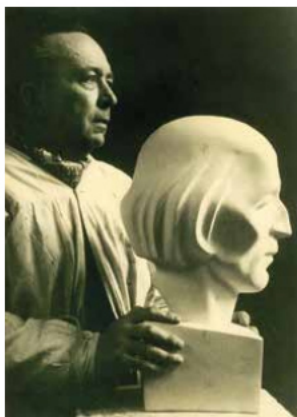
RBF: Arbeit am Modell Nils Stensen für das Bischöfliche Amt Schwerin, im Atelier Ahrenshoop 1973

Was ich zu Anfang dieser sehr unvollkommenen Gedanken sagte: Ich mute keinem Künstler zu für wahr zu halten, was für mich richtig scheint.